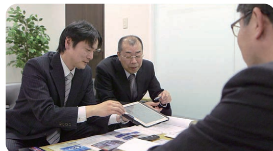
コンサルティング